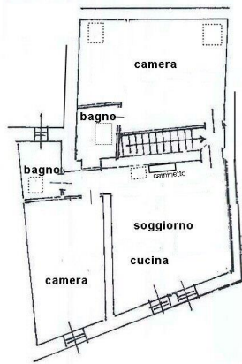
PIANO TERZO ipotesi di modifica