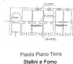
Pianta Piano Terra Stallini e Forno